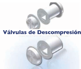
Válvulas de Descompresión